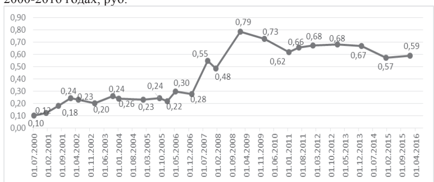
Рис. 3. Отношение МРОТ к прожиточному минимуму в 2000-2016 годах

В 2000 году было наименьшее соотношение МРОТ к прожиточному минимуму – всего 0,1, т.е. минимальная заработная плата покрывала лишь 10% прожиточного минимума трудоспособного гражданина. С 2001 по сентябрь 2007 года данное соотношение не превышало 0,3, затем наблюдался резкий рост до 0,55. Максимальное соотношение было по состоянию на 1.01.2009 года – 0,79, затем было снижение до 0,68- 0,66, которое наблюдалось до 2014 года. К 2015 году коэффициент понизился до 0,57, а по состоянию на 1 января 2016 года – 0,59. Конечно же, если сравнить с данными начала 2000-х годов, то показатели улучшились, однако нормы, закрепленные в законодательстве все же на протяжении последних 16 лет, не выполнялись.