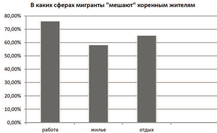
Рисунок 2. Воспринимаемые коренным населением «помехи» и угрозы со стороны иммигрантов

Мы решили выяснить, что конкретно повлияло на негативное отношение коренных жителей к мигрантам (можно было отметить несколько вариантов ответа). Вариант ответа «личный опыт взаимодействия» выбрали 79,1 % респондентов; «опыт других людей» 66,9%; «средства массовой информации» – 47,6 %.