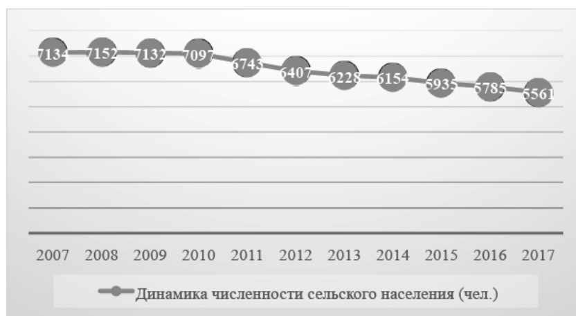
Рис. 1 Динамика численности сельского населения

Согласно международным критериям, население считается старым, если доля людей в возрасте 65 лет и более во всем населении превышает 7%. Таким образом, возрастная структура сельского населения Сычевского района не соответствует возрастной структуре страны. Сычевское сельское население стареет в два раза быстрее среднероссийского. Количество сельских жителей Сычевского района уменьшилось за 10 лет на 1349 человек, из них 968 – естественная убыль населения деревень (Рис. 1). [1] В основном, из села уезжает молодежь после окончания школы, трудоспособное население, потерявшее работу в родном селе, или недовольные уровнем заработной платы в деревне.