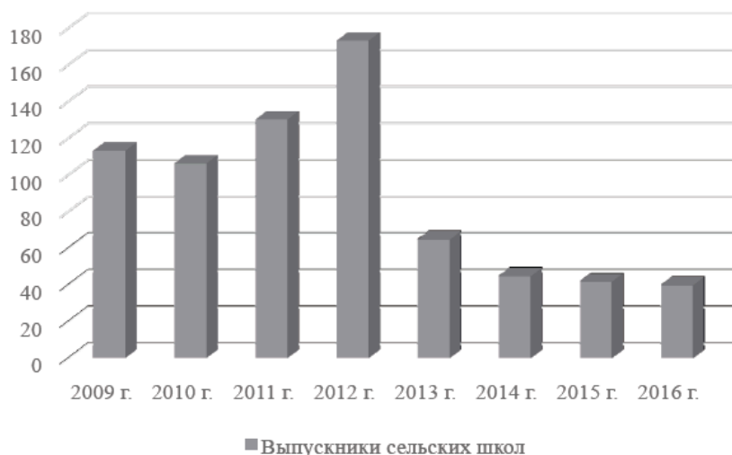
Рис.3 Количество выпускников основных общеобразовательных сельских школ

В ходе исследования был проведен социологический опрос сельских школьников. В опросе принимало участие 27 человек. Опрашиваемым был задан вопрос: после окончания школы (техникума, ВУЗа) будете ли Вы стремиться уехать из села? 23 человека ответили – да, 2 человек – нет, 2 человек не определились. (Рис.4)