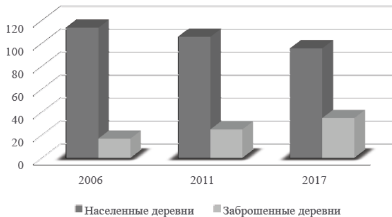
Рис. 2 Динамика количества населенных и заброшенных деревень

На протяжении последних десяти лет устойчиво сокращается общая численность деревень. Есть все основания полагать, что данная тенденция сохранится и в ближайшие годы, поскольку в настоящее время в районе сохраняется большое количество деревень (37) с населением до 10 человек. В основном это жители, относящиеся к возрастной группе старше трудоспособного возраста т.е. старше 65 лет. В результате естественной убыли населения эти 37 деревень в ближайшее время рискуют присоединиться к заброшенным (Рис. 2).